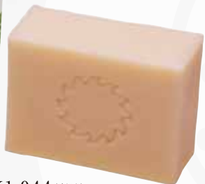
青パパイヤとオリーブオイルで作ったサプリメントソープ