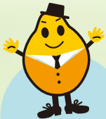
タンパク質分解酵素